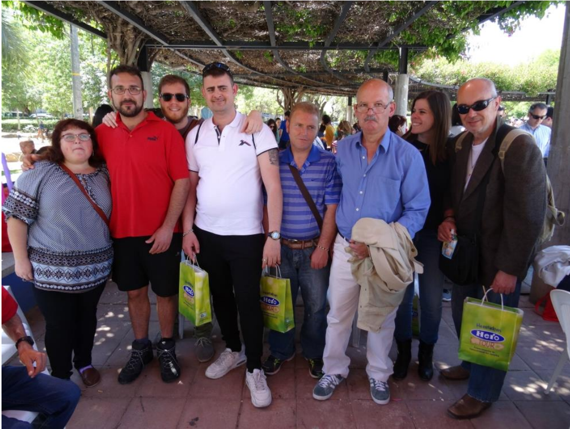
Día de la familia

CIF: G 73619801 C/ Poeta Cano Pato, 2, Edificio Libertad, 1L 30.009 Murcia Teléfono 968 23 29 19 info@fusamenmurcia.com www.fusamenmurcia.com